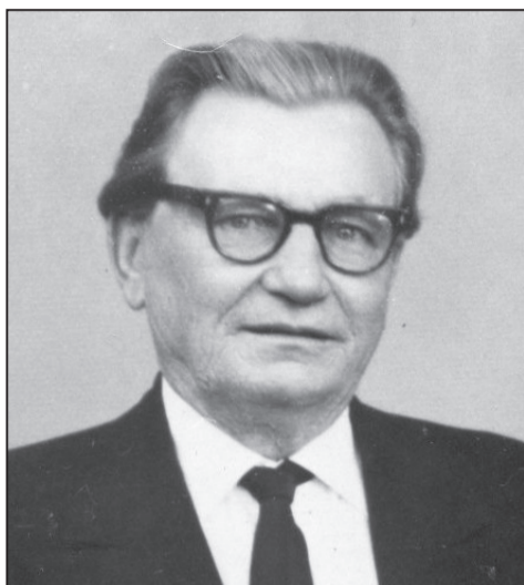
Лявон Савёнак. 1970-я гг.