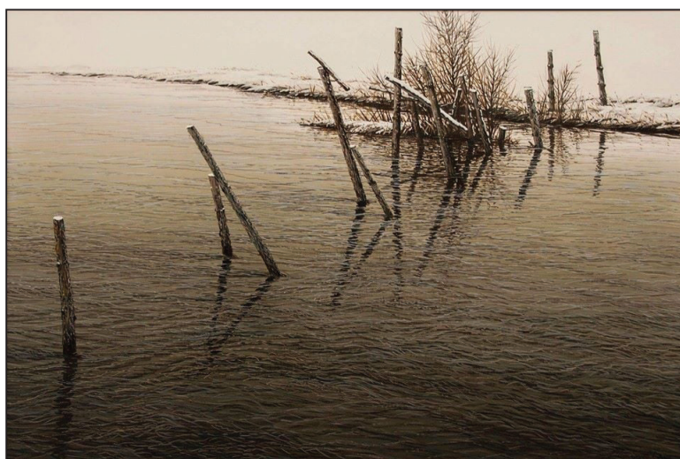
Валерый Шкаруба. «На рэчцы», 2014 г.

Сустрэўшы мяне неяк на праспекце, Шкаруба пахваліўся альбомам і запрасіў на гарбату ў майстэрню, дзе збіраўся ўручыць кнігу з аўтографам. У той дзень я спяшаўся на планёрку ў сваё выдавецтва. Паход па альбом адклаўся. Потым Валера перабраўся з вежы на Незалежнасці ў вежу на Сурганава. Мы з ім бачыліся гады ў рады на нейкіх прыёмах і выставах. Часам Валера нагадваў мне пра альбом, які чакаў мяне ў яго