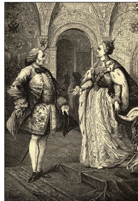
Дзідро і расійская царыца Екацярына II. Ксілаграфія Альфрэда Рамбо.

Дзідро быў запрошаны ў Пецярбург імператрыцай Кацярынай II, самаўладнай распусніцай, «прасветленай» дыктатаркай, якая гутарыла з ім доўгімі гадзінамі, слухала ўважліва і з цікаўнасцю, хоць і не ўсе ідэі, натуральна, падзяляла і разумела. Але, не зважаючы на некаторыя разыходжанні ў поглядах, яна выкупіла ягоную Бібліятэку, а самога Дзідро прызначыла сваім дабрадцем-«смотрителем», забяспечыўшы Дэні годнае існаванне, бо ён марнеў у галечы, нягледзячы на небывалы поспех «Энцыклапедыі».