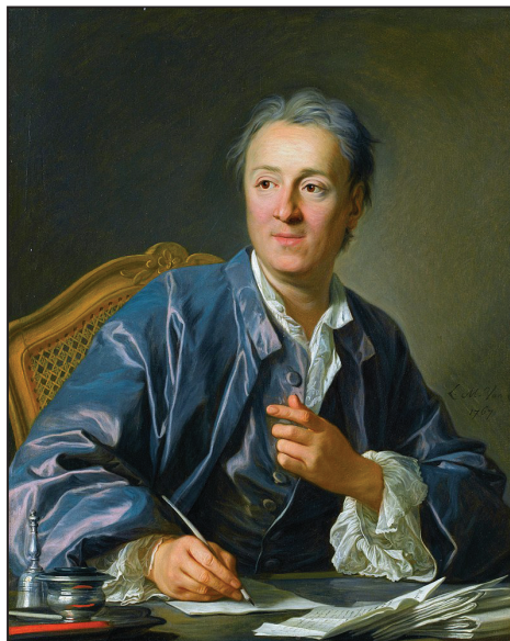
Партрэт Дэні Дзідро працы Луі-Мішэля ван Лоа. 1767 г.

У мастацкіх творах Дзідро таксама заставаўся верным сабе, спачатку захапіўшыся стварэннем п'ес, потым пераклучыўшыся на прозу. Самі па сабе яго п'есы былі не вельмі ўдалымі — ён быў нашмат мацнейшым у прозе. Важна іншае: да XVIII стагоддзя драматургія, як ні дзіўна, не ведала жанру драмы, задавальваючыся толькі трагедыяй і камедыяй. Але калі першая заўсёды распавядала аб перыпетых вышэйшага саслоўя, а другая закранала толькі пацешныя і бытавыя моманты, то Дзідро лагічна вырашыў, што патрэбен нейкі сярэдні — як ён скажа — «сур'ёзны жанр», які ў сваёй