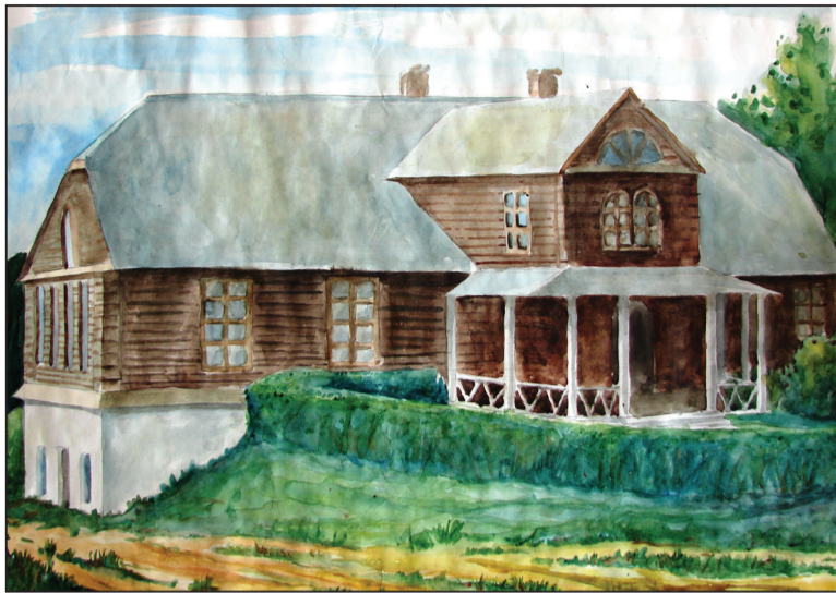
Колішняя сядзіба ў Міжрэччы. Малюнак з архіва аўтара

Матэрыялам для другога паверха паслужылі дубовыя бярвенні. З яго ўзвядзеннем быў перанесены і галоўны ўваход на супрацьлеглы бок. На рызаліце — галерэя з маленькіх калон, крытая дошкамі. З боку ракі, але на той самай вышыні, месцілася лоджыя. Дах высокі, пад гонтай. Праз усе паверхі праходзілі два вялікія коміны. Унізе размясцілася кухня, пякарня, склеп, гаспадарчыя памяшканні. Наверсе — сталовая памерамі 8 на 5 м, салон 7 на 5 м. Па абодвух