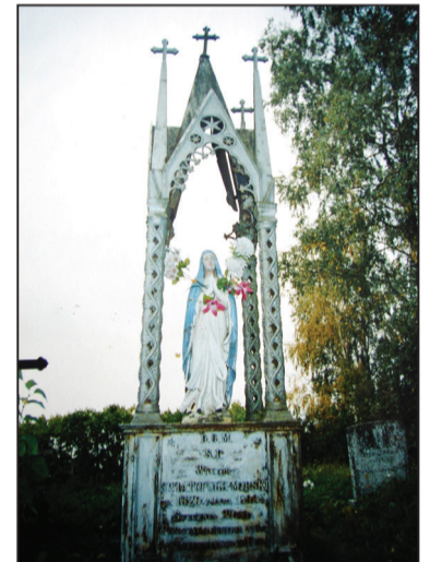
Помнік канца XIX ст. на мясцовых могілках

Нягледзячы на разбурэнне сядзібы, яе адметныя руіны вельмі захапляюць турыстаў. Ад векавых алей яшчэ захавалася частка магутных дрэў. А на вясковых могілках у вёсцы Сташулі — дзякуючы клопату мясцовых жыхароў — захаваліся прыгожыя помнікі на магілах колішніх уладальнікаў маёнтка Міжрэчча.