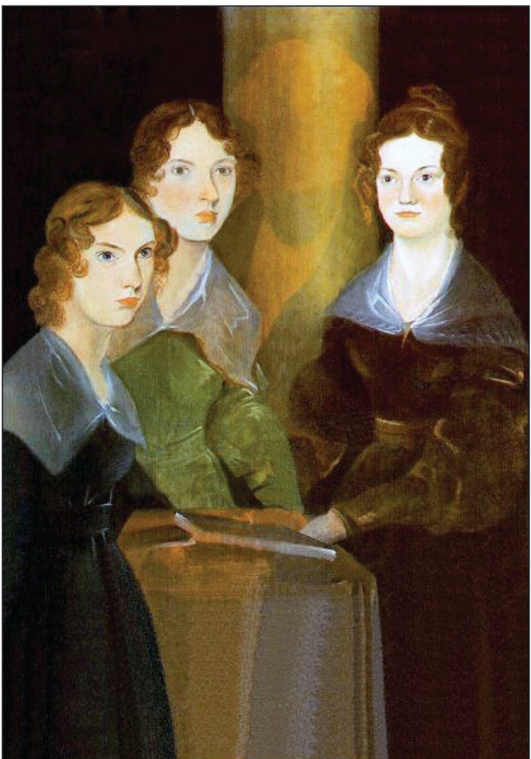
Партрэт сясцёр Бронтэ, 1835 г. У цэнтры бачны зацерыты сілуэт брата Брэнуэла.

Усё гэта мы называем протафемінізмам, але для спадчыны сясцёр Бронтэ важна нават не гэта. Важна тое, што яны былі таленавітыя настолькі, што за той нядоўгі перыяд жыцця, які ім быў адведзены, змаглі стварыць тэксты такой значнасці, што мы вяртаемся да іх зноў і зноў на працягу васьмі ўжо амаль двух стагоддзяў.