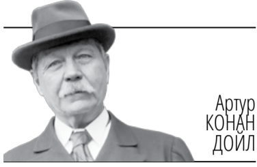
Артур КОНАН ДОЙЛ

Цікавая са мной адбылася гісторыя, раскажыце хатні настаўнік, адзін з тых дзівосных і фантастычных выпадкаў, якія здараюцца з чалавекам у жыцці. Я страціў найлепшае месца працы, якое толькі мог атрымаць. Але я задаволены тым, што трапіў у Торп-Плэйс, бо прыдбаў, але пра тое, што я прыдбаў, вы даведаецеся з майго апаведу.