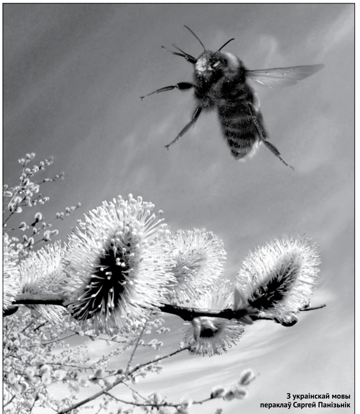
З украінскай мовы пераклаў Сяргей Панізьнік

Чмель сцеражэ мой садок. Кветачку не пацалуеш, — Пыжыць ён свой завіток: — Хто ты? Ч-ч-чаго тут ш-ш-шуреш? — Мой берагун залаты! Кветачку я ўздавала. А ўберажэш толькі ты Грацыю пахкага бала!