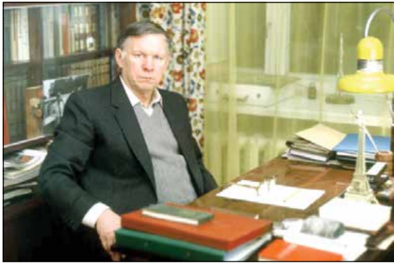
У працоўным кабінце, Мінск