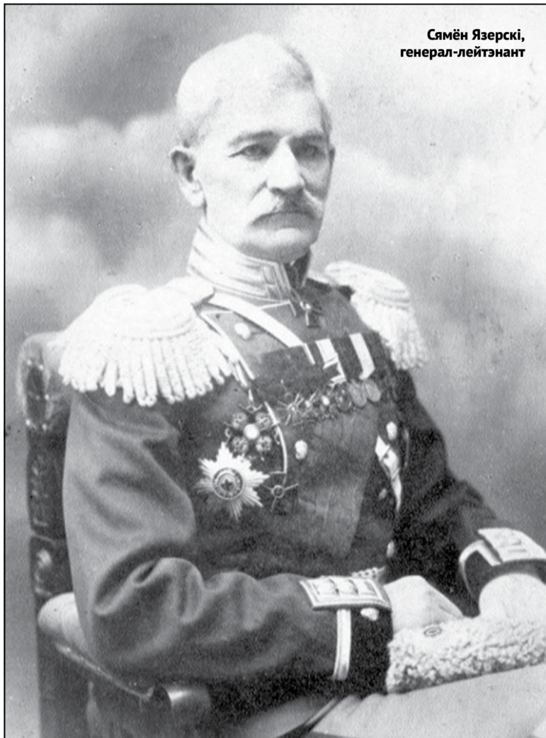
Сямён Язерскі, генерал-лейтэнант

З такіх быў і бацька будучага гомельскага «камунара». Сямён Язерскі нарадзіўся ў 1852 годзе пад Гомелем. Прыналежаў, скончыў Гомельскую прагімназію. Але яго бацькі былі дробнамаёнтакавымі дваранамі, і пракарміць юнака маглі толькі служба. Сямён абраў ваенную. У 1870 годзе ён стаў вольнавызначаным у чыне унтэр-афіцэра 64 пяхотнага Казанскага палка, што кватарыаваў у Беластоку. Кажучы сучаснай мовай — «кантрактнікам». Праз чатыры гады армейскай службы Сямён паступіў у Рыжскую пяхотную юнкерскую вучэльню. У 1876 годзе скончыў яе па першым разрадзе і ў званні прапаршчыка. І вярнуўся да мінулага месца службы на Беласточчыну. А ў 1877 годзе 16-я пяхотная дывізія пераехала на Балканы, на фронт новай руска-турэцкай вайны. 4-ы армейскі корпус, у склад якога ўваходзіла дывізія, спачатку быў у рэзерве. Але пасля першых няўдач царскай арміі пад Плеўнай корпус перакінулі да гэтай турэцкай цвярдзіні. Тады ж камандзірам 16-й дывізіі быў прызначаны Міхаіл Скобелеў, знакаміты «Белы генерал» (празваны ён быў так не за прыхільнасць да манархізму, а за звычку выязджаць пад кулі ў прыкметным белым мундзіры).