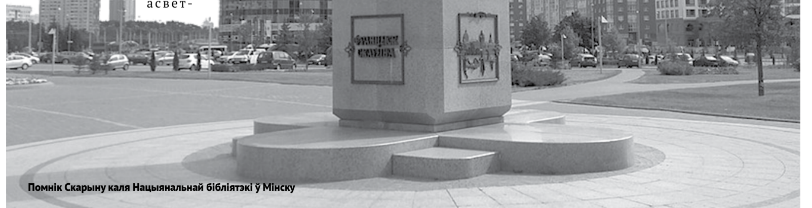
Помнік Скарыну каля Нацыянальнай бібліятэкі ў Мінску