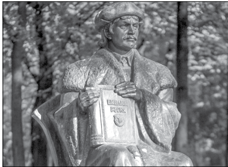
Помнік Скарыне ў дворыку БДУ Мінск

ніку побач з Полацкам, Прагаю і Кракавам адсутнічае Вільня! Абуральны факт! Мы маем права патрабаваць выпраўлення такой недарэчнасці.