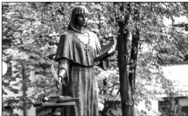
Помнік Ефрасінні Полацкай у Мінску

цэнту Дуніну-Марцінкевічу і Станіславу Манюшку. Помнік наводзіць на добрыя думкі і праменіць душэўнай цеплынёй. Тое наша культура, беларуска-літоўскі дух. Гэтыя героі тут жылі, вучыліся і працавалі; тут зусім блізка стаяў будынак, дзе яны паставілі сваю аперэтку. І гэта вельмі кранальны сюжэт, таму што ён — жывая гісторыя. На жаль, і ў помніку Вінцэнту Дуніну-Марцінкевічу і Станіславу Манюшку захавалася тэндэнцыя неразвітага п’едэсталу.