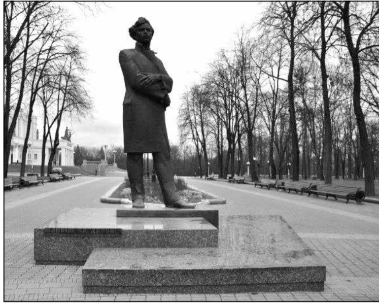
Помнік Максіму Багдановічу

Аўтэнтычна тут толькі беларуская архітэктура, якая чакае сапраўднай рэстаўрацыі і аднаўлення. На плошчы Волі нядаўна ўсталявалі помнік Він-