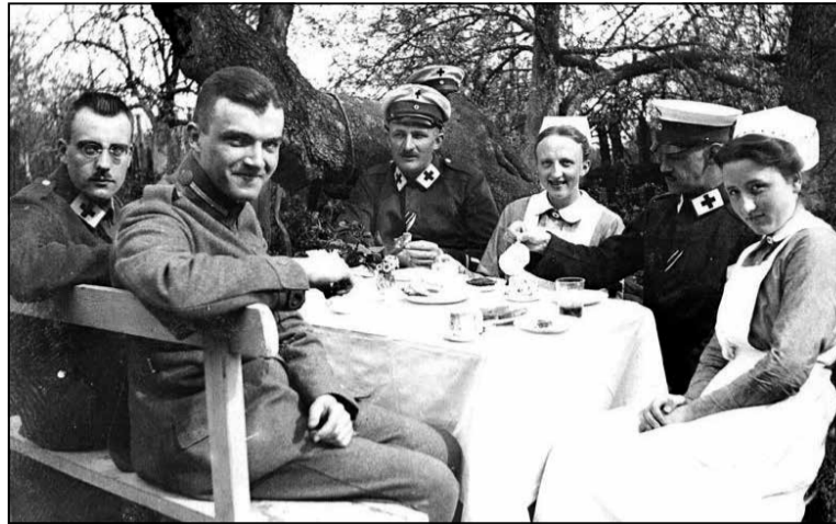
Немцы ў Гродне, Першая сусветная вайна

Уліпені-жніўні 1920-га, пасля ўзяцця гораду бальшавікамі, партработнікі пачалі збіраць паперы і дакументы пра факты гвалту, які палякі ўчынялі ў дачыненні да яўрэяў. Вырваныя бароды, заколатыя штыкамі