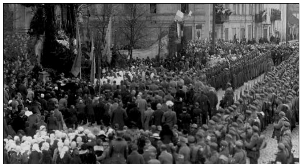
Польскія войскі ў Гродне, красавік 1919 года