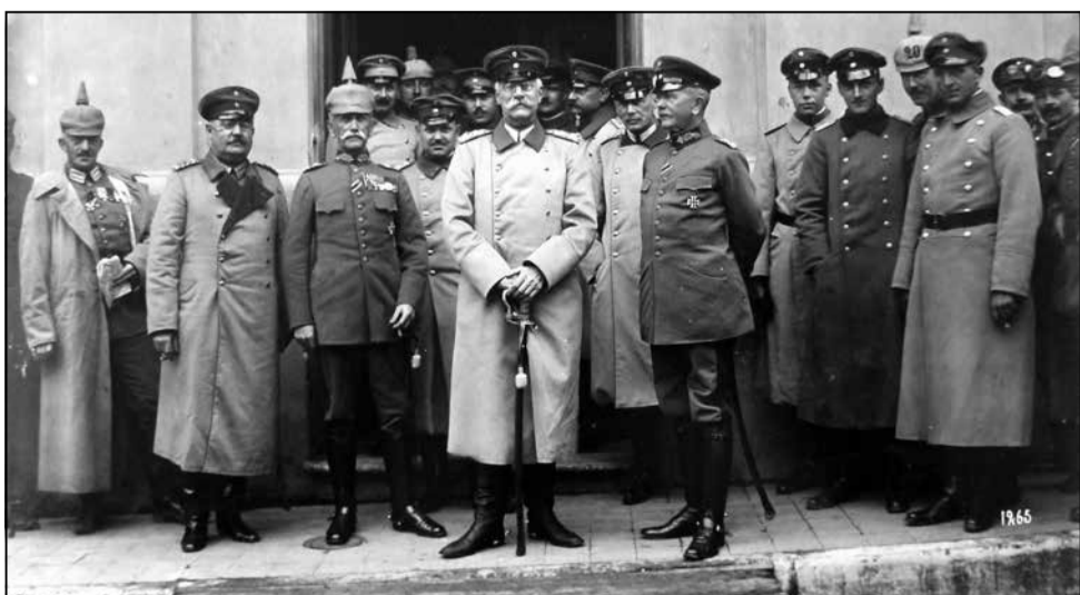
Немцы ў Гродне, Першая сусветная вайна