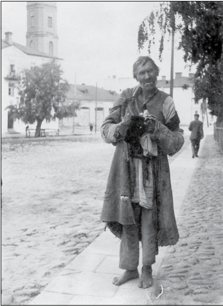
Жабрак у Гродне ў часы Першай сусветнай вайны

«...Найперш з Гродна знікла яўрэйскае насельніцтва: знікла па экстранным намаганні добрых рускіх уладаў, якія, мабыць, лічылі, што тэрміновае высяленне яўрэйў зможа замяніць няслабачу снарадаў і памылкі ў планах генеральнага штабу, — піша Бухаў пра пачатак вайны. — Пасля пачалі рабіць уцекачоў з мясцовых палякаў. Палякі з’ехалі, за імі пакінулі горад і чыноўнікі. Што ў горадзе засталася? Невядома. Кажуць, засталася армія, якая таксама адступіла. Дзеяцца, што з гораду было выселена і сышло ўсё, акрамя аднаго кульгавага