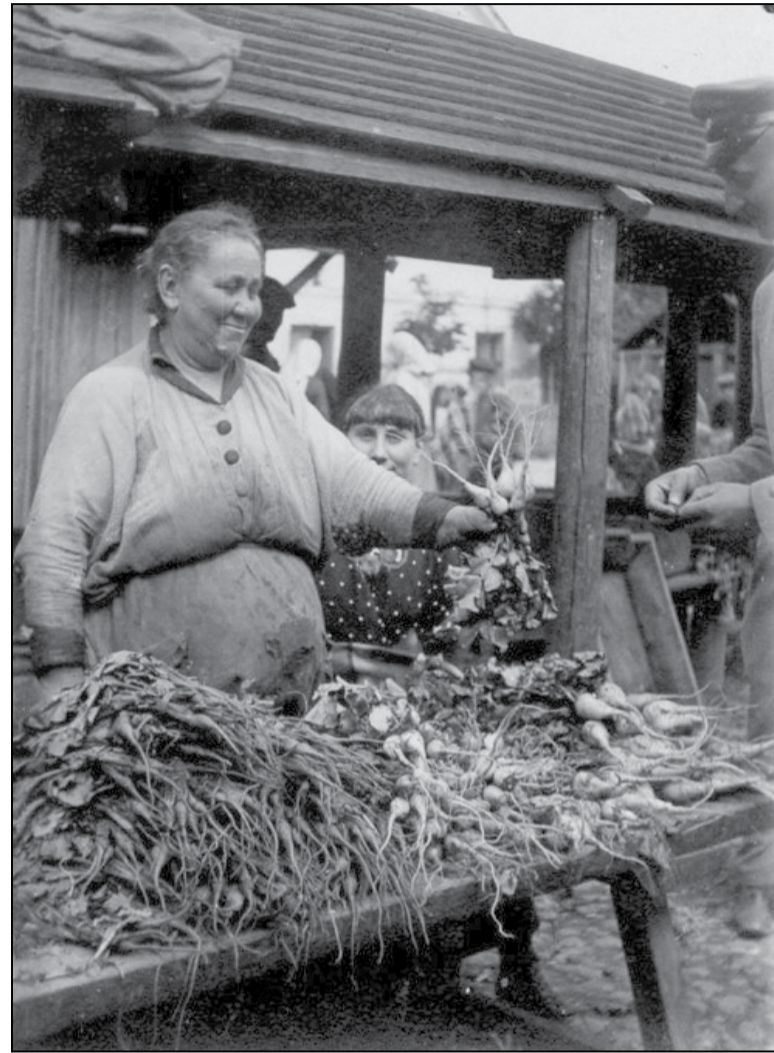
Прадавачка на рынку ў Гродне часоў Першай сусветнай вайны

краўца, які мне пасля і распавёў пра гэта».