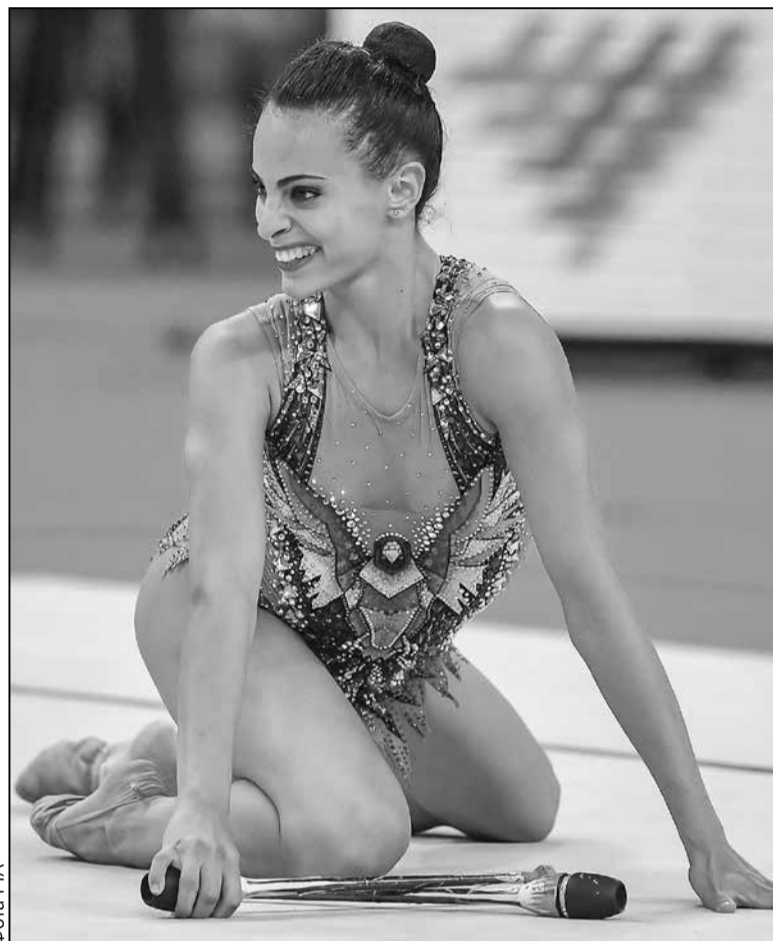
Лінай Ашрам: спартыўны гонар Ізраіля

Тут зусім іншае стаўленне да войска: ім ганарацца. Ніхто не хаваецца ад прызыву, не «косіць» з дапамогай бацькоў і знаёмых медыкаў. Наадварот, служыць у арміі — гэта ганаровы абавязак кожнага ізраільскага юнака і дзяўчыны. А ў тых, каму служыць у войску забараняе