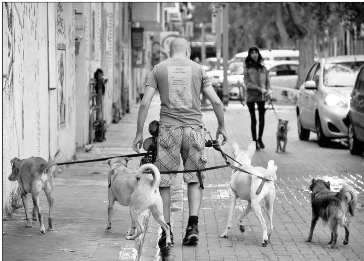
Сабака — сябар чалавека ў Ізраілі

Але, зноў жа, жыццё ёсць тым, што мы пра яго думаем, і таму кожны выбірае сваё шчасце сам.