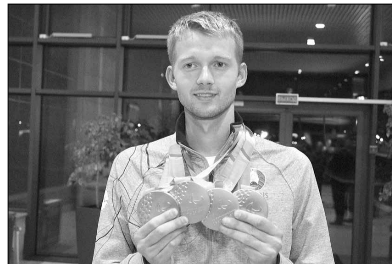
Ігар Бокі: лідар сусветнага інваспорту

Якраз гэтыя лічбы называюцца ў якасці задачы-мінімум цяпер. І тут, нарэшце, чытачам стане зразумела, чаму часцей за ўсё ў гэтым матэрыяле мы кранаем справы ў басейне, дакладна — на воднай дарожцы. Адказ просты: найбольшы