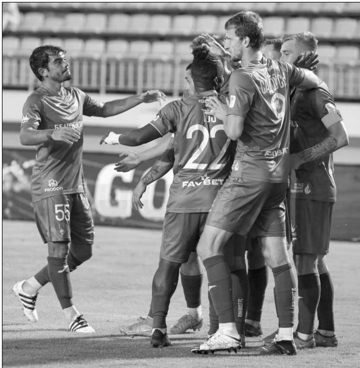
У якую будучыню рушыць брэсцкі «Рух»?

Напэўна, футбольная Рэчыца і гэтым разам рэінкарнуе недзе ў другой лізе — адпаведны досвед мае. Але гэта будзе ўжо зусім іншая гісторыя — пра што заўгодна, але не пра прафесійны спорт.