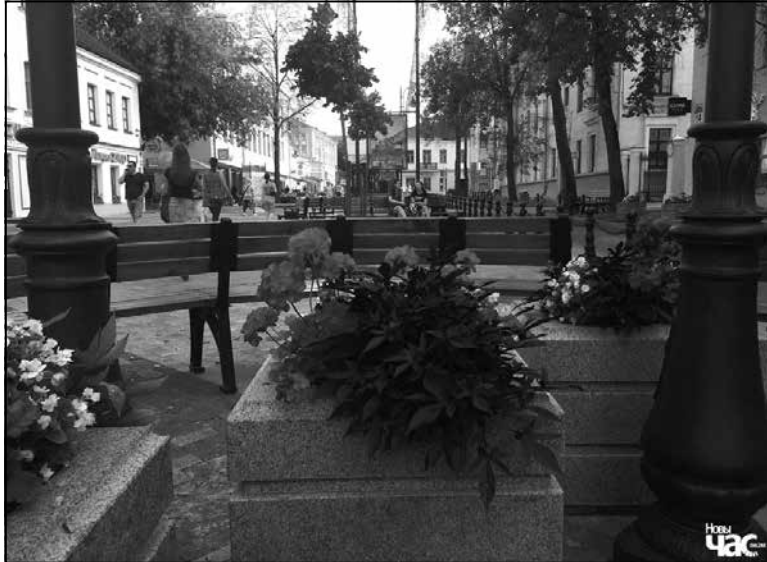
Вуліца Камсамольская ў Мінску.

Напрыклад, мы заўсёды ведалі, што хіпстарты ў Мінску ёсць, але калі з’явілася Кастрычніцкая — месца, дзе яны могуць праявіцца, яны сабраліся тут. Або возьмем прыклад Зыбіцкай. Нібыта таксама пешаходная вуліца, шмат кавярняў, але там зусім іншая публіка. І гэта цікава, калі пэўная інфраструктура