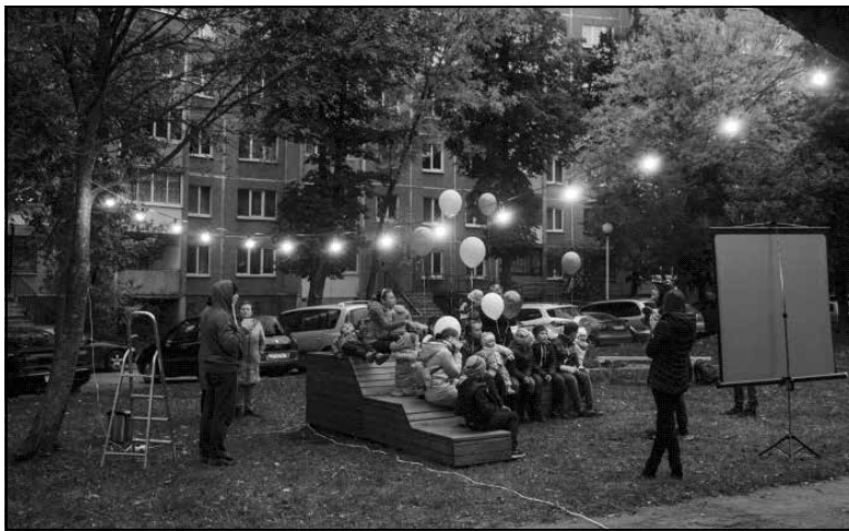
Праект «Альтэрнатыўны двор: Серабранка».

працягвае розныя пласты грамадства, іх запыты і гатоўнасць мець менавіта гэты лайфстайл.