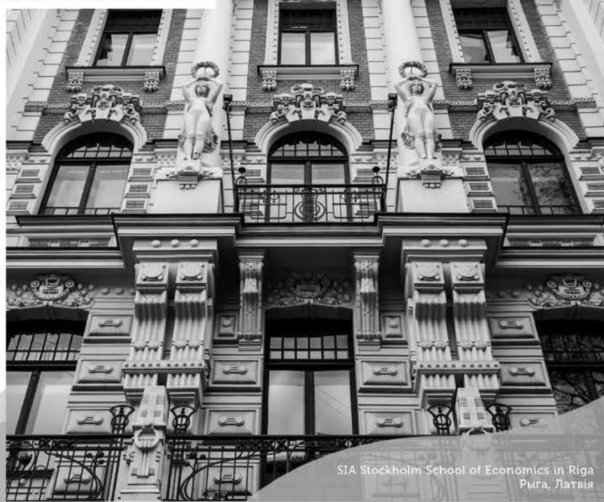
SIA Stockholm School of Economics in Riga Рыга, Латвія