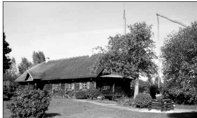
Музей-сядзіба Адама Міцкевіча

Нарэшце, вандроўка па цікавым Баранавіцкім краі прывяла нас да вёскі Завоссе, паблізу якой знаходзіцца музей-сядзіба Адама Міцкевіча. Пасля Першай сусветнай вайны ад сядзібы