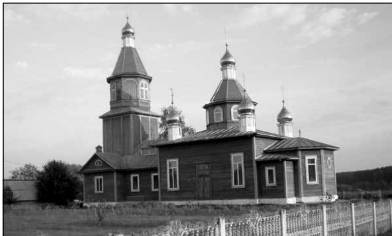
Вёска Палонка. Царква Св. Параскевы Пятніцы (1880 г.)

У 1860 годзе тут было 160 двароў, 1030 жыхароў, дзейнічала народная вучэльня, тры яўрэйскія школы, бровар, цагляны завод. У 1825 годзе быў пабудаваны касцёл Перамянення Божага, а ў 1859 годзе — Праабражэнская царква. Некалі па службовых справах мне даводзілася праязджаць праз вёску, але я тады не ведаў пра яе такое багатае мінулае. Памяць свайго выдатнага земляка Яна