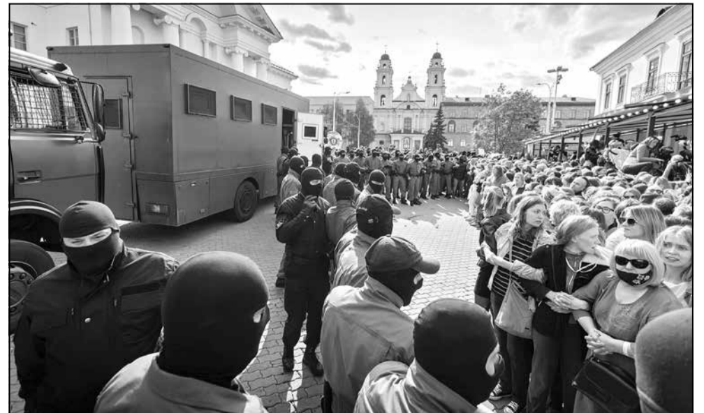
Затрыманні на Жаночым маршы. Мінск, 12 верасня 2020 года.