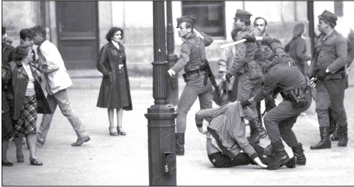
Міліцыя збірае людзей, ПНР

Вось што было ў гэтым дакуменце: «Абстаноўка ў ПНР працягвае заставацца напру-