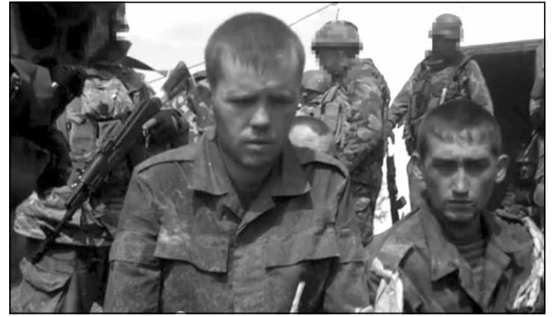
Кадр знакамітага відэа допыту расійскіх ваеннапалонных, якія трапілі ў палон да УС Украіны пад Ілавайскам