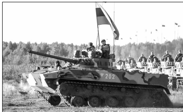
Дэсантнікі 234-га ДШП УС РФ пад Брэстам, верасень 2020 года.

На тле паўнавагаснага разгортвання ў ваенным плане так званай «Саюзнай дзяржавы» ствараецца аперацыйная прастора для рэалізацыі дыверсій на мяжы Беларусі з Еўрасаюзам і Украінай, што надае мажлівасць Расіі істотна павялічыць свой вайсковы кантынгент у Беларусі дзеля ўсталявання поўнага ваенна-палітычнага кантролю над нашай краінай.