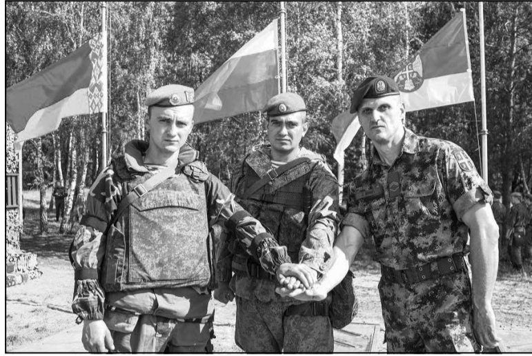
Падчас адкрыцця супольных вучэнняў «Славянскае братэрства-2017».

Першапачатковы фармат вучэнняў прадугледжваў удзел толькі дэсантных падраздзяленняў Узброеных сіл (УС) Паветрана-дэсантных войскаў (ПДВ) РФ, Сілаў спецыяльных аперацый УС РБ і сербскага