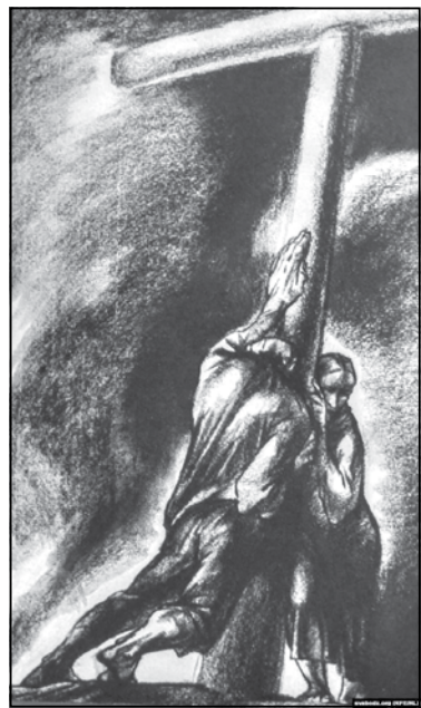
Ілюстрацыя Арлена Кашкурэвіча да кнігі Васіля Быкава «Знак бяды»

Да жніўня 2020 года большасць беларусаў верыла ў сілу закона. Яшчэ ў чэрвені адзін з кандыдатаў у прэзідэнты, адказваючы на пытанне, што будзе, калі яго арыштуюць, са шчырым (ці добра ўдаваным)