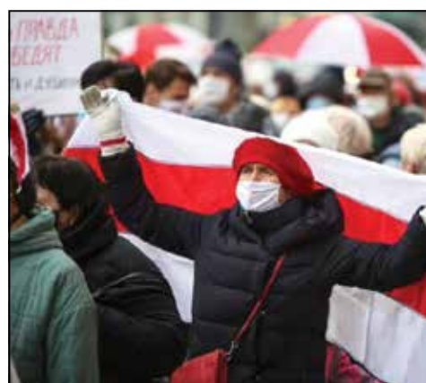
Марш 9 лістапада.