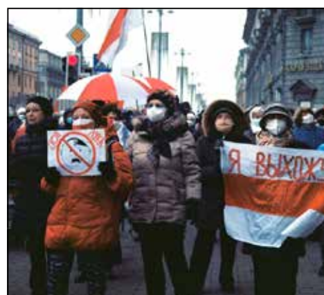
Марш мудрасці 16 лістапада. Фота НЧ