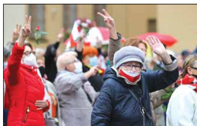
Марш 12 кастрычніка.