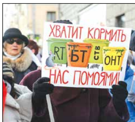
Марш 19 кастрычніка.