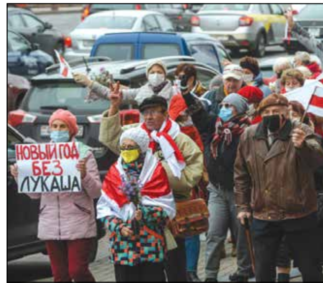
Марш 2 лістапада.

Вось яны — вось Маршаў Мудрасці. Вось адчайных выклікаў сістэме.