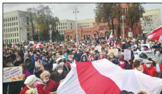
Ммарш 26 кастрычніка.