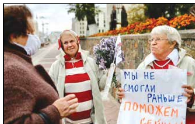
Марш 5 кастрычніка.