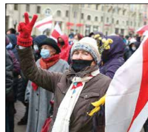
Марш 23 лістапада.