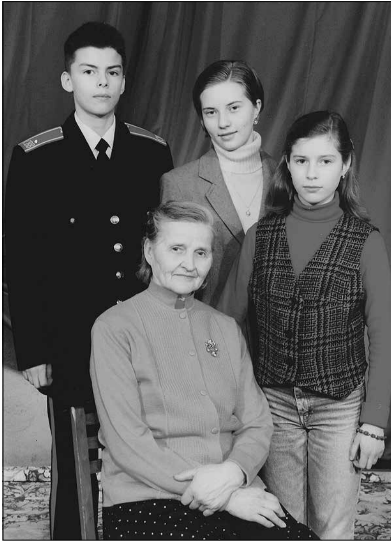
Разам з сям’ёй падчас вучобы ў Сувораўскай вучэльні

— Не ведаю. Магчыма, нешта змянілася, калі я сышоў, таму гэта маё персанальнае ўражанне. Не магу сказаць, што там выкладалі зусім дрэнна, наўпрост усё было неяк... прасталінейна — што па матэматыцы, што па гісторыі. Трэба завучыць, пераказаць — і ты круты! Магчыма, Сувораўская вучэльня папросту рыхтавала ўніверсальных тэхнакратаў, якія маглі б працаваць у сістэме, але творчары жылка ці самастойнае мысленне было для іх неабавязковым, а часам — шкодным.