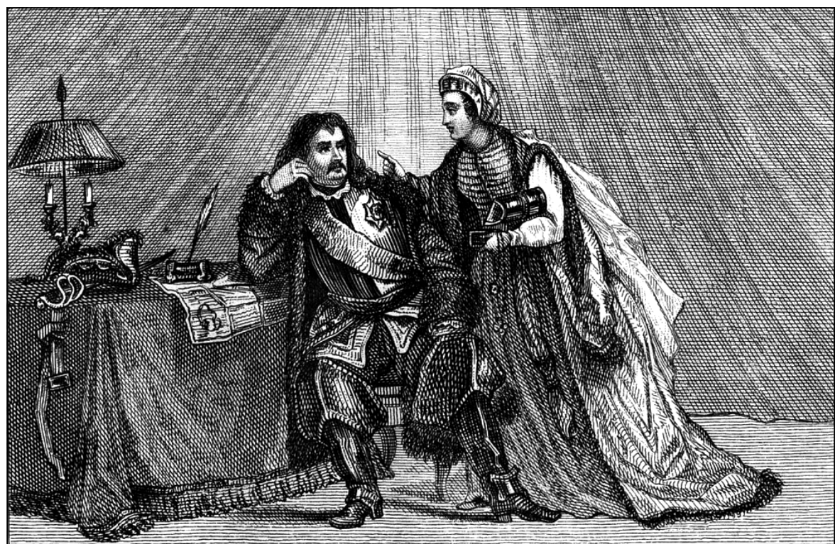
Размова Пятра I і Кацярыны ў намёце пры Пруце. Гравюра