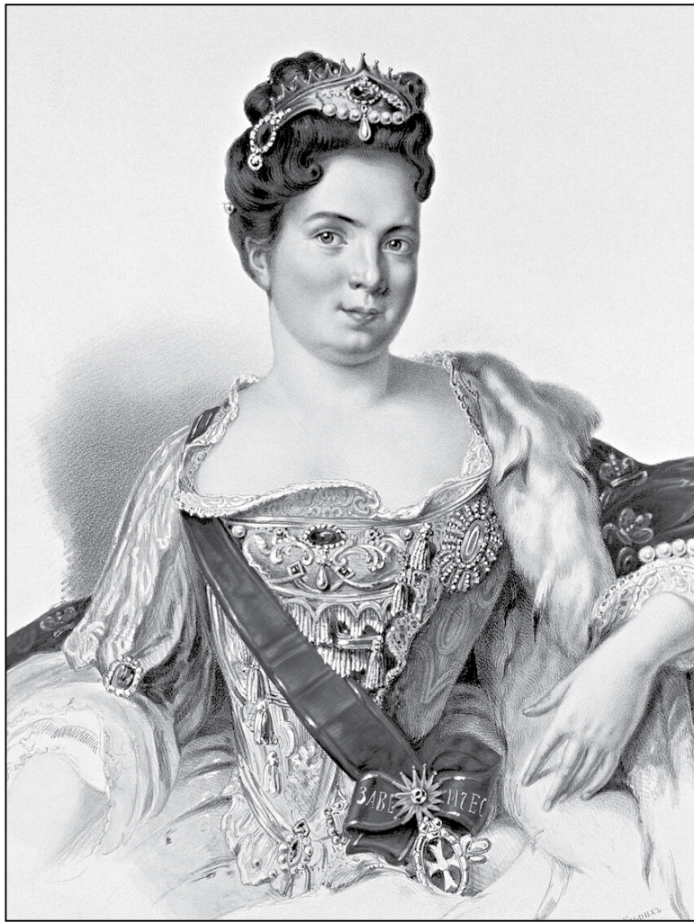
Кацярына I. Партрэт Ж.-М. Нац'е

Наколькі Святое пісанне падзейнічала на Барыса Шарамецева, невядома. Але Марта яму відавочна спадабалася. Ды так,