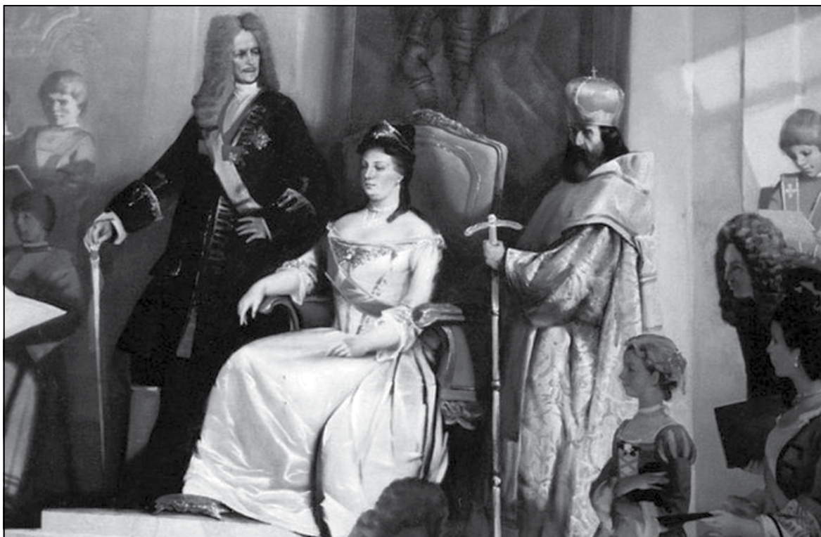
Каранацыя Кацярыны I

Вядома, Марта Скаўронская найперш прывабіла Пятра як жанчына. Але, калі пакінуць за дужкамі алкоўны бок, можна