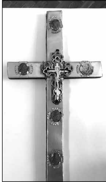
Крыж, зроблены Лысенкам

— Мы за грошы Банка развіцця зрабілі фізіка-тэхнічную экспертызу гэтых абразкоў у Інстытуце цепла-масаабмена