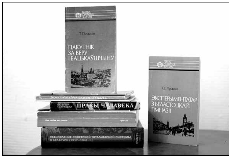
Плён працы Таццяны Процька — яе кнігі

каб захаваць сваю «цноту», — я гэтага не разумею.