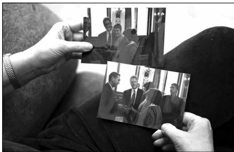
У архіве Таццяны Процька ёсць фота з Білам Клінтанам

— Гэта вялікая памылка. У таталітарнай і аўтарытарнай сістэмах ёсць адзіны механізм перабудовы грамадства і ўсяго жыцця — гэта ўлада. Таталітарная сістэма знішчае іншыя механізмы. І аддаць проста так самы дзейны механізм у рукі тых, каго ты лічыш ворагам,