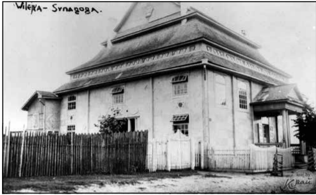
Сінагога ў Вілейцы