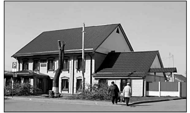
Сінагога ўЛюбані. 2015 г.