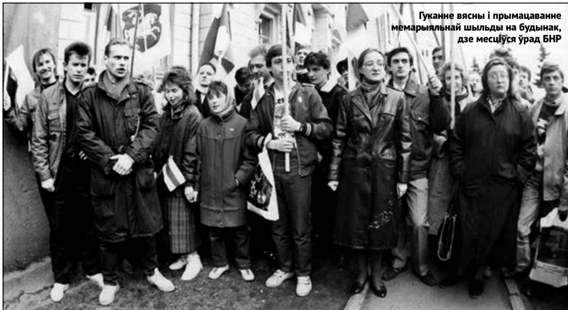
Гуканне вясны і прымацаванне мемарыяльнай шыльды на будынак, дзе месціўся ўрад БНР

Маці яшчэ ў цягніку моцна пасябрала са сваёй новай сястрой Галяй, і праз усё жыццё яны захавалі надзвычайную блізкасць. Галя — гэта традыцыйнае свойскае імя для Ганны, як, зрэшты, і Марыяў там звалі