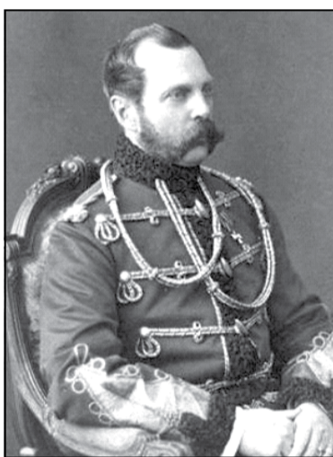
Расійскі імператар Аляксандр II

спыняцца ні перад чым, нават ахвяруючы ўласным жыццём.