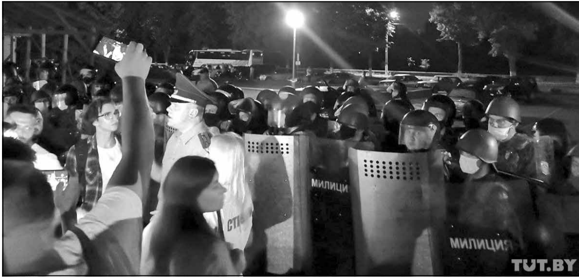
Пінск. Жнівень 2020-га

«Потым ля ІЧУ сустракалі тых, хто вярнуўся з гэтага пекла, — узгадвае Таццяна. — Збітых было вельмі шмат. І дзяўчат, і хлопцаў, і маладых, і любога ўзросту. На нашых вачах стаялі хлопцы збітыя. Усе чорныя — спіны, рукі. Яны наогул не былі ў тых дні на выбарчых падзеях. Яны былі на рыбалцы. І прыехалі вечарам у панядзелак. Спусціліся ў краму, каб купіць прадуктаў. І аказаліся ў аўтазак».