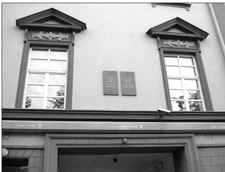
Дом у Вільні, дзе жыў Станіслаў Манюшка

беларускай літаратуры Вінцэнтам Дуніным-Марцінкевічам.