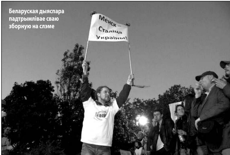
Беларуская дыяспара падтрымлівае сваю зборную на слэме

Так, часты госць фестываля — этна-гурт «Джамбінбум», які спалучае беларускі фальклор з музычнымі матывамі ўсяго свету. Літаратурным VIP-госцем БВ стаў пісьменнік Уладзімір Арлоў, ён выступіў у Кіеве ў тандэме з пісьменнікам Аляксандрам Ірванцом, і ў Львове ў тандэме з паэткай Мар'янай Саўкай, пра