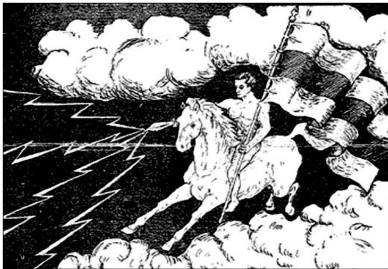
Язэп Горыда. «Маланка»