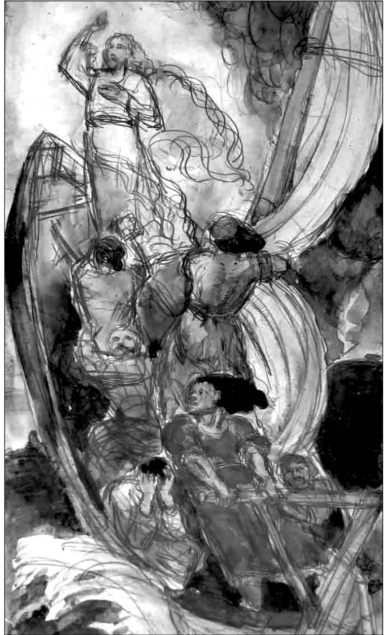
Пётр Сергіевіч. «Утайманне буры»

БССР (1944), Член-карэспандэнта АМ СССР (1950), Народнага мастака РСФСР (1966) — Мадорава Фёдора Аляксандравіча, што быў прадстаўлены партрэтам Сяргея Прыгтышкага (1913–1971), эцюдамі і эскізамі да карціны «Народны сход у Заходняй Беларусі».