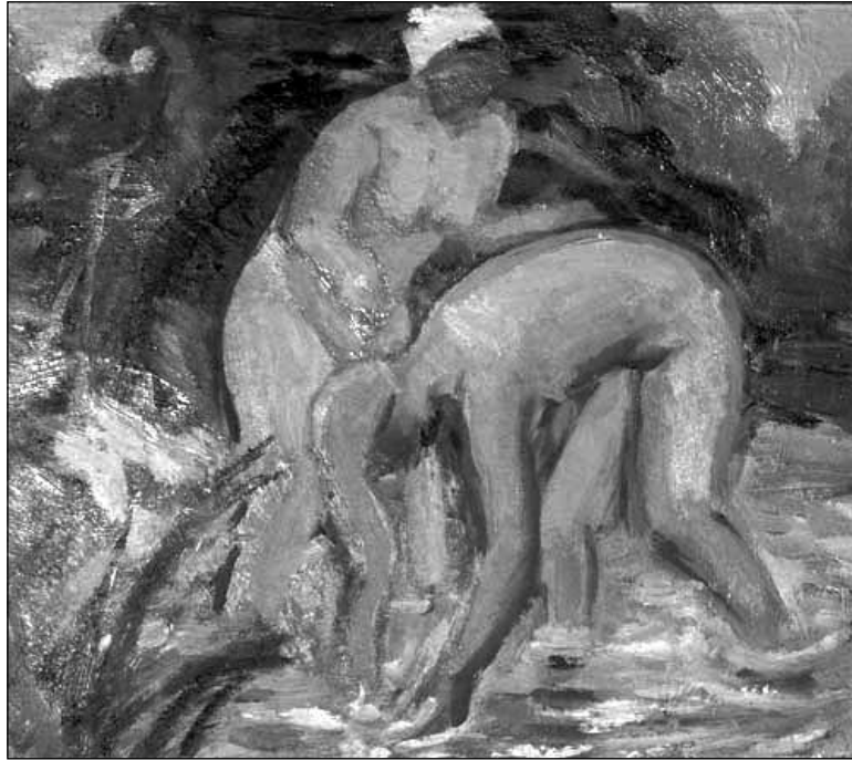
Міхась Сеўрук. «Купальніцы»

Ураўнаважвалі «заходнебеларускую плынь» работы «партрэта, жанрыста, аўтара карцін на гісторыка-рэвалюцыйную тэму, які маляваў пейзажы, нацюрморты, займаўся графікай, Заслужанага дзеяча мастацтваў