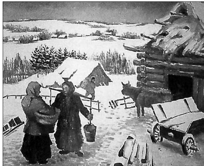
Пётр Мірановіч. «Суседкі»

Намаганні наоў народжанай беларускай літаратуры пачатку ХХ стагоддзя, які і выяўленага