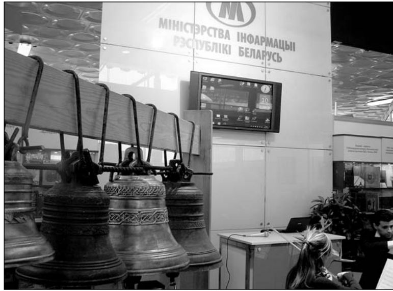
На адкрыцці XVII Міжнароднага кніжнага кірмашу Міністэрства інфармацыі сімвалічна біла ў званы ўзаемапараўнення

Як паказвае апытанне, усе як адзін прыватныя выдаўцы, зарэгістраваныя ў Беларусі, лічаць удзел у кірмашы на такіх умовах вар'яцтвам. Паколькі ў прыватных выдавецтваў аб'ёмы кніжнай прадукцыі вельмі малыя, ніхто з іх не мае рэсурсаў нагадліваць за чатыры дні і на палову гэтай сумы. Пра гэта мне