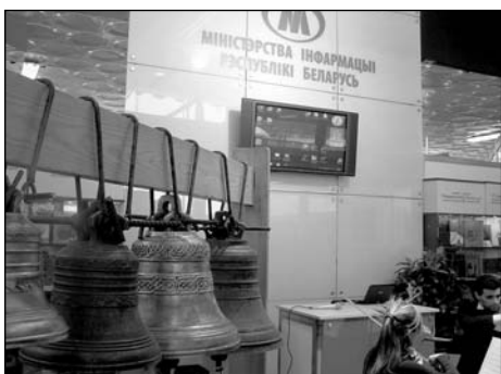
НЯМА КАГО БАЙКАТАВАЦЬ