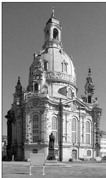
Фраўэнкірхен: 1970 г. і сёння

Але сутарэнні былі надзейным сховішчам. ...Да поўдня назаўтра выходзіць са сховішча было небяспечна. Калі ж амерыканцы і іхняя ахова выйшлі навуны, неба было скрозь ахутана чорным дымам. Злое сонца падавалася наверхам цвіка. Дрэздэн выглядаў падобна да Месяца — адны мінералы. Камні расправіліся. Смерць была наўкола...»