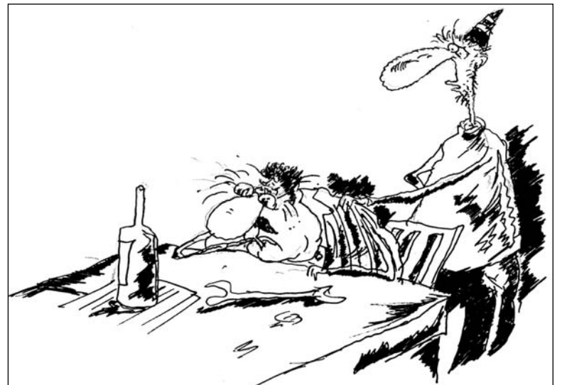
«Ну добра. Годзе, Міхалыч, мы можам заставацца сябрамі». Малюнак аўтара

— Міхалыч, прабач. Нам сапраўды добра з Анатолем (так звалі