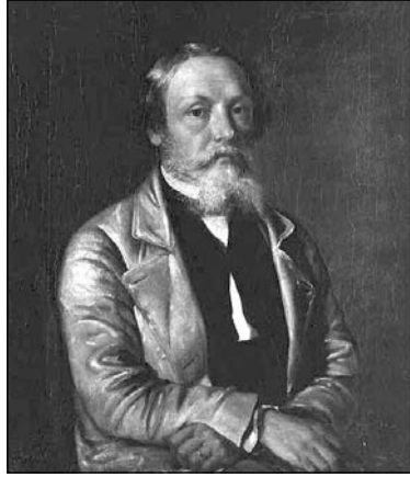
Іван Хруцкі. Аўтапартрэт. 1884

Яго лёс пераплецены з няпростай гісторыяй Беларусі. Будучы мастак прыйшоў на свет у сям'і уніяцкага святара Фамы Хруцкага ў тыя часы, калі краіна,