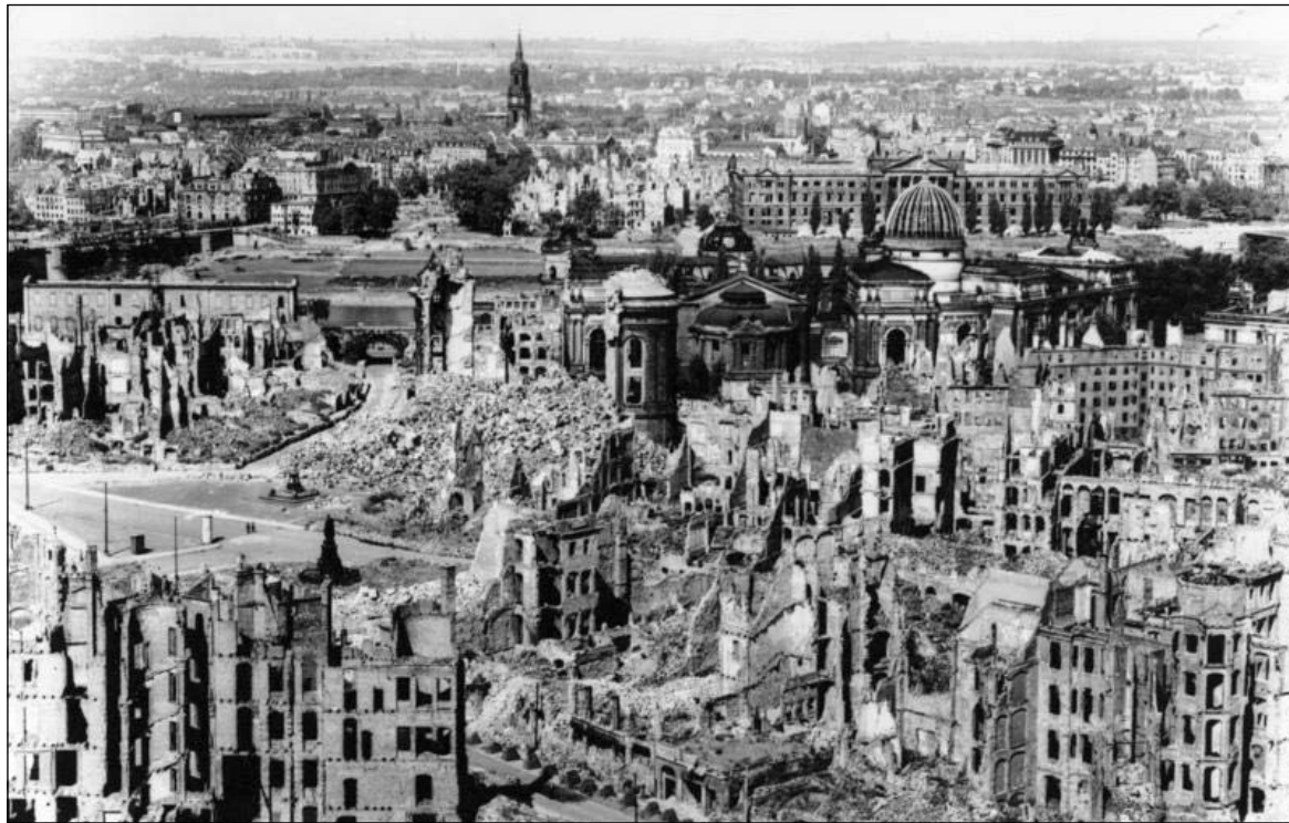
Дрэздэн. 1945 г.

«... Ён быў унізе, у халодных сутарэннях, у тую ноч, калі разбамбілі Дрэздэн. Наверсе чуліся гукі, падобныя да тупату веліканаў. Гэта выбухалі шматтонныя бомбы. Веліканы тупалі і тупалі.