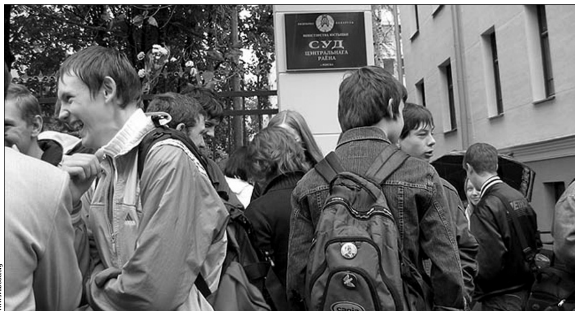
Дзе быў ліцэй, там сёння суд. Здымак 01.09.2006 г.