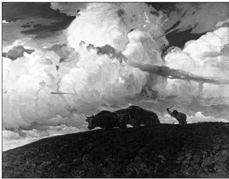
Фердынад Рушчыц. Зямля. 1898 г.

Не ведалі мэтры, што апрача эстэтычных уражанняў, якія фіксаваліся ў таропкіх эскізах ды