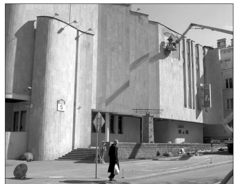
Дом літаратара да і пасля «касметычнай рэканструкцыі»