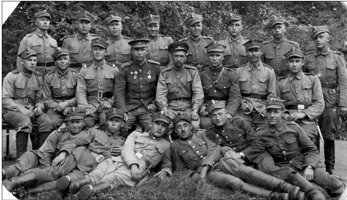
Пераможцы. Байцы НВП і савецкія афіцэры, 30 чэрвеня 1945 г. (з архіва, публікацыя ўпершыню)

Справа ў тым, што ў маі 1943 года ў вёсцы Сяльцы пад Масквой пачалося фармаванне польскай дывізіі для выкарыстання яе на ўсходнім фронце. 12–13 кастрычніка 1944 года пад вёскай Леніна (Магілёўская вобласць) гэта вайсковая частка, якая ўваходзіла ў