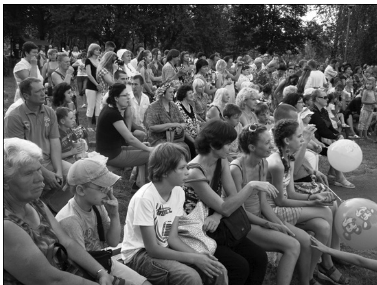
Любань вітае «Таўкачыкі»