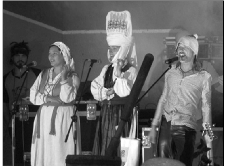
На сцэне «UR'IA»