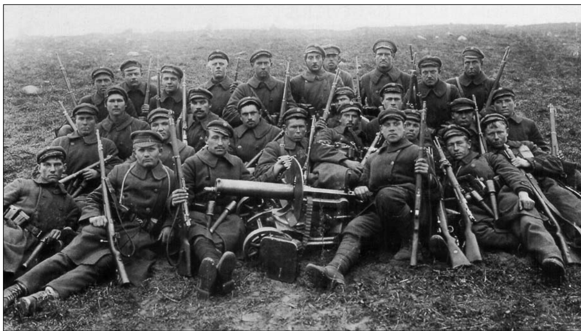
Салдаты-беларусы літоўскага войска