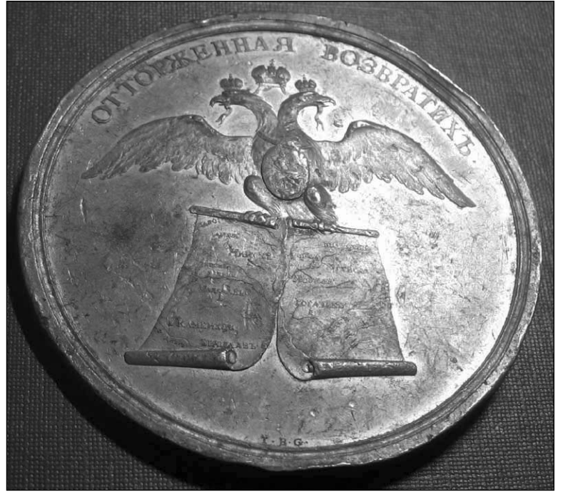
Медаль Кацярыны ў памяць падзелаў Рэчы Паспалітай

дыцыйнай рускай культуры». А б чым гаворка, калі спачатку Маскоўская дзяржава жорстка і крывава далучыла да сябе суседнія княствы, а потым пайшла з мячом на ВКЛ? Дзе гэта разуменне этнічных межаў? Яго гістарычна не было. Масква, а потым і Расійская імперыя, кіраваліся адным — імперскімі амбіцыямі. Прычым, часцей за ўсё, свае экспансіўныя планы Расія рэалізоўвала не сваімі сіламі, а пры дапамозе знешніх саюзнікаў. Падчас падзелаў Першай Рэчы Паспалітай гэта былі Прусія і Аўстрыя, а ў 1939 годзе хаўруснікам Масквы стала нацысцкая Германія.