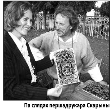
Па слядах першадрукара Скарыны

беларускасць як у моўным, так і ў гістарычна-этнаграфічным плане. І тое, што насельніцтва гэтых невялікіх гарадкоў з энтузіязмам успамінае пра сваё нацыянальнае паходжанне, пра багатую гісторыю краіны і сваёй малой радзімы, не заставалася па-за ўвагай ні ўдзельнікаў святкавання, ні мясцовых уладаў.