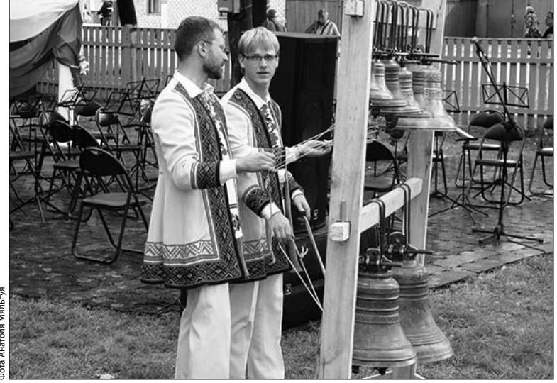
Канцэрт званоў Беларускай праваслаўнай царквы

1 верасня ў Быхаве адбылося XX Свята беларускага пісьменства і друку. Для ўдзелу ў гэтай важнай культурніцкай падзеі многія прадстаўнікі беларускай інтэлігенцыі рана-раненька выправіліся са сталіцы ў гэты горад з мэтай паўдзельнічаць у вялікім аглядзе літаратурнай і выдавецкай дзейнасці дзяржаўных структур, якія па свайму статусу павінны спрыяць развіццю Роднага Слова.