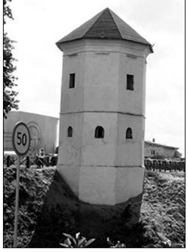
Быхаўскі замак. Сучасны выгляд

Так, да пачатку Свята беларускага пісьменства і друку ў Быхаве была праведзена рэканструкцыя кінатэатра «Родина», адбылося адкрыццё Быхаўскага раённага цэнтра культуры, чыгуначнай станцыі «Быхаў» і іншых устаноў гарадской інфраструктуры. А вось гістарычная спадчына горада чакае сваёй рэстаўрацыі. Свята беларускага пісьменства і друку, будзем спадзявацца, дасць імпульс яе адраджэнню. І наступным разам Быхаў прадстане перад яго гасцямі як горад з сапраўды вялікай гісторыяй, у якім і жыхары, і мясцовыя ўлады з павагай ставяцца да Роднага Слова.