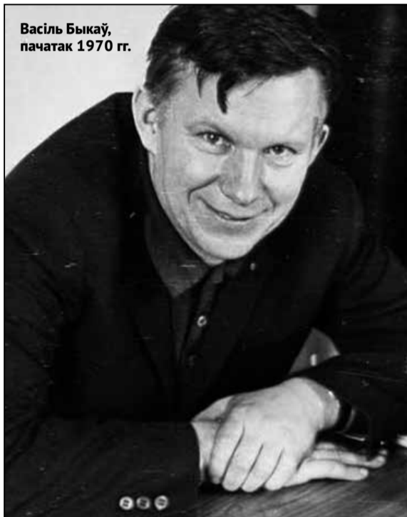
Васіль Быкаў, пачатак 1970 гг.

Да 90-годдзя Васіля Быкава ў выдавецтве «МЕДЫЯЛ» пры падтрымцы мецэната Паўла Бераговіча выйшлі адразу дзве ўнікальныя кнігі — «Мёртвым не баліць» і «Ліквідацыя» — і абедзве ўпершыню апублікаваныя без тых цэнзурных купюр, якія былі зроблены ў аповесцях падчас іх першай публікацыі і якія пераходзілі на працягу дзесяцігоддзяў з аднаго выдання ў другое.