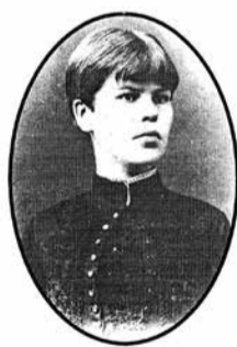
МАРЫЯ БАГДАНОВІЧ 1869—1896

І ціха думаў я: быць можа, Любоў, палішы у трунах, Пераматла і смерці жаж!