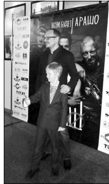
На лістападаўскай прэм'еры.