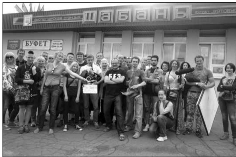
Творчая брыгада.

роткімі фінальнымі разважанымі. Удалы, цыннічна-радасны досвед быў жыццёў перанесены ў «ГараШ», але тут ужо Кулінковіч разгарнуўся напоўніцу.