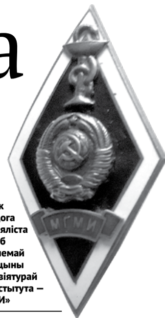
Значок маладога спецыяліста — ромб з эмблемай медыцыны і абрэвіятурай медінстытута — «МГМИ»

чаў займацца яшчэ да вайны і працягнуў свае доследы пасля яе, прысвяціўшы гэтаму 15 гадоў лекарскай працы. Адпаведна, набыў ґрунтоўны досвед, сабраў значны даследчыцкі матэрыял, на які абапіраліся ягонныя высновы. Высновы не толькі абгрунтаваныя, але і, як кажучь, выпакутаваныя. Пэўна, у час абароны апаненты не знайшлі з ім паразумення і — «трапіла каса на камень».